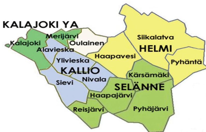
Kuvio 1. Oulun Eteläisen osahankkeen toimintaympäristö

Oulun Eteläisen osahankkeessa (kuvio 1) ovat Nivala-Haapajärven, Haapaveden - Siikalatvan ja Ylivieskan seutukuntien kunnat. Alueelle toimii Peruspalvelukuntayhtymä Kallio, johon kuuluvat Alavieskan ja Sievin kunnat sekä Nivalan ja Ylivieskan kaupungit. Peruspalvelukuntayhtymä Selänne, johon kuuluvat Reisjärven ja Kärsämäen kunnat sekä Haapajärven ja Pyhäjärven kaupungit, aloittaa toimintansa v. 2010 alussa. Haapaveden - Siikalatvan seutukunnan kunnat jatkavat terveystaluesalueen yhteistyötä sosiaali- ja terveystaluespiiri Helmessä, jonka isäntäkuntana toimii Haapavesi. Kalajoen kaupunki tuottaa myös Merijärven sosiaali- ja terveystaluespalvelut ja Oulaisten kaupunki on solminut yhteistyösopimuksen Pohjois-Pohjanmaan sairaanhoitopiirin kanssa.